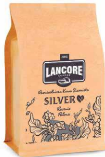
LANCORE COFFEE SILVER BLEND

200 g P1470 18,56 zł* 1000 g P1471 74,27 zł*