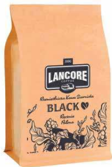
LANCORE COFFEE BLACK BLEND

225 g P1460 22,13 zł* 500 g P1461 42,13 zł* 1000 g P1462 82,84 zł*