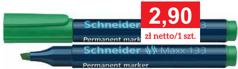
H0725 H0726 H0727 H0728