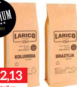
LARICO KOLUMBIA EXCELSO