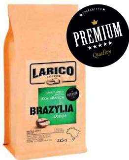
LARICO BRAZYLIA SANTOS

225 g P1452 22,13 zł* 470 g P1453 42,13 zł* 970 g P1454 82,84 zł*