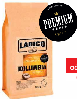
LARICO KOLUMBIA EXCELSO

225 g P1452 22,13 zł* 470 g P1453 42,13 zł* 970 g P1454 82,84 zł*