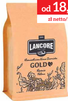
LANCORE COFFEE GOLD BLEND

200 g P1466 18,56 zł* 1000 g P1467 74,27 zł*